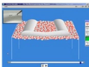
Abb. 5: Animation zu Experiment 2

[Begriffe: Spannung, Anspannung, Netzwerk von Kräften, Oberflächenspannung, äußere Einwirkung, äußere Kräfte]