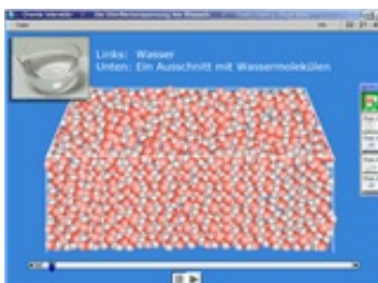
Abb. 1: Ein Ausschnitt mit Wassermolekülen

Am Präsentations-Computer können Lehrer oder Lehrerinnen die Flash-Folien bzw. Flash-Infos als Unterrichtsmedium im Unterrichtsgespräch einsetzen.