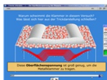
Abb. 6: Erläuterungen zum Experiment 2 (Folie 4)

[Begriffe: Spannung, Anspannung, Netzwerk von Kräften, Oberflächenspannung, äußere Einwirkung, äußere Kräfte]