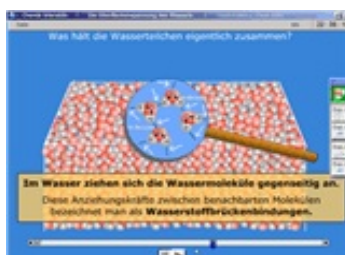
Abb. 2: Erläuterung der Wasserstoffbrücken - Bindungen